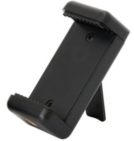
⑧ スマートフォンホルダー(WT-09MA) 品番 : 4907990806024 希望小売価格(税別) : ¥1,300