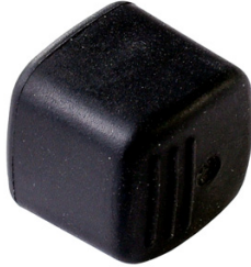
⑥ G11石突ゴム 品番 : 4907990803146 希望小売価格(税別) : ¥400