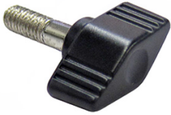
⑤ EX300 EVストッパー 品番 : 4907990804808 希望小売価格(税別) : ¥400