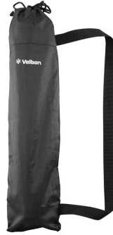
⑦ 付属ケースP2 品番 : 4907990806260 希望小売価格(税別) : ¥1,000